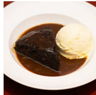
スティッキートフィープディング