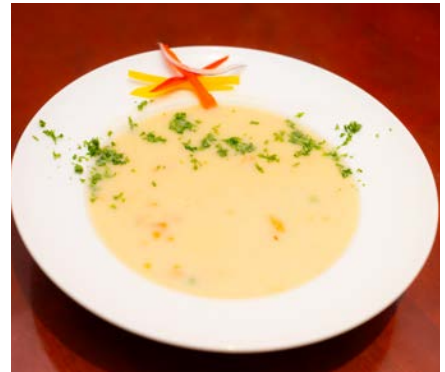
クリームチャウダー