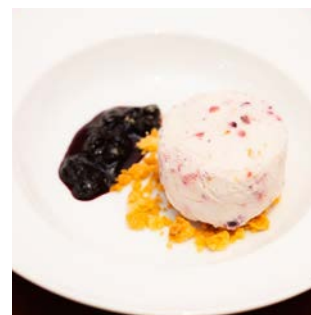
メレンゲサンデー