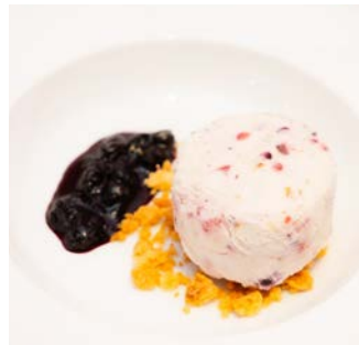
メレンゲサンデー