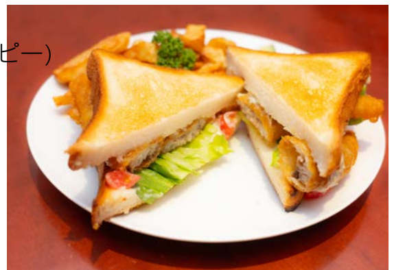
フィッシュサンドウィッチ

*ランチセットにはコーヒー/紅茶(ともにHOT/ICED)がつきます。 キッズランチに限りオレンジジュースも選べます。