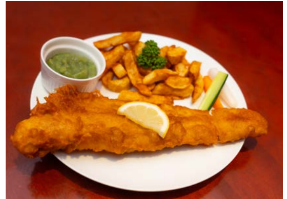
スペシャルフィッシュ&チップス