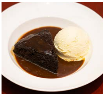
スティッキートフィーディング