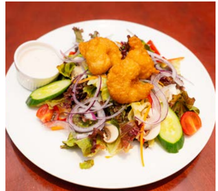
シーフードサラダ

ベジタブルサラダ ¥1,000 シーフードサラダ ¥1,100 *ドレッシングをお選び下さい (和風/フレンチ/シーザー)